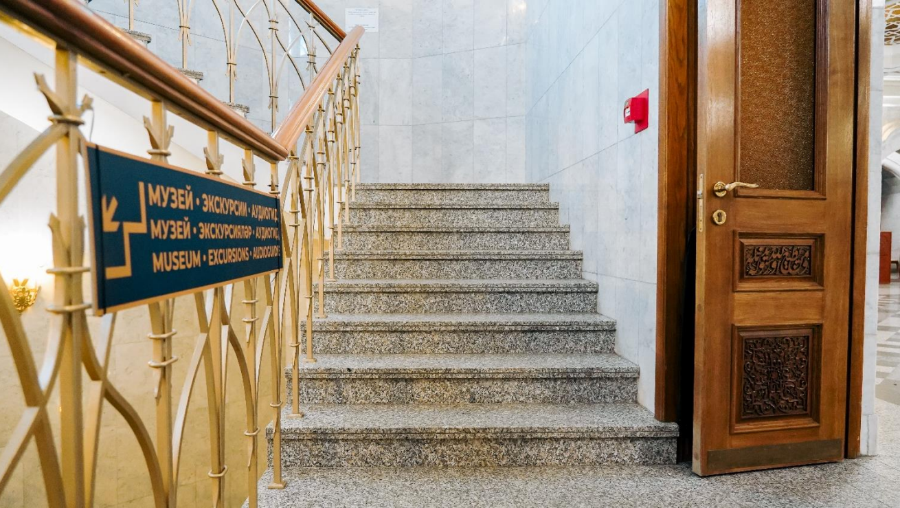
Лестница выглядит так.