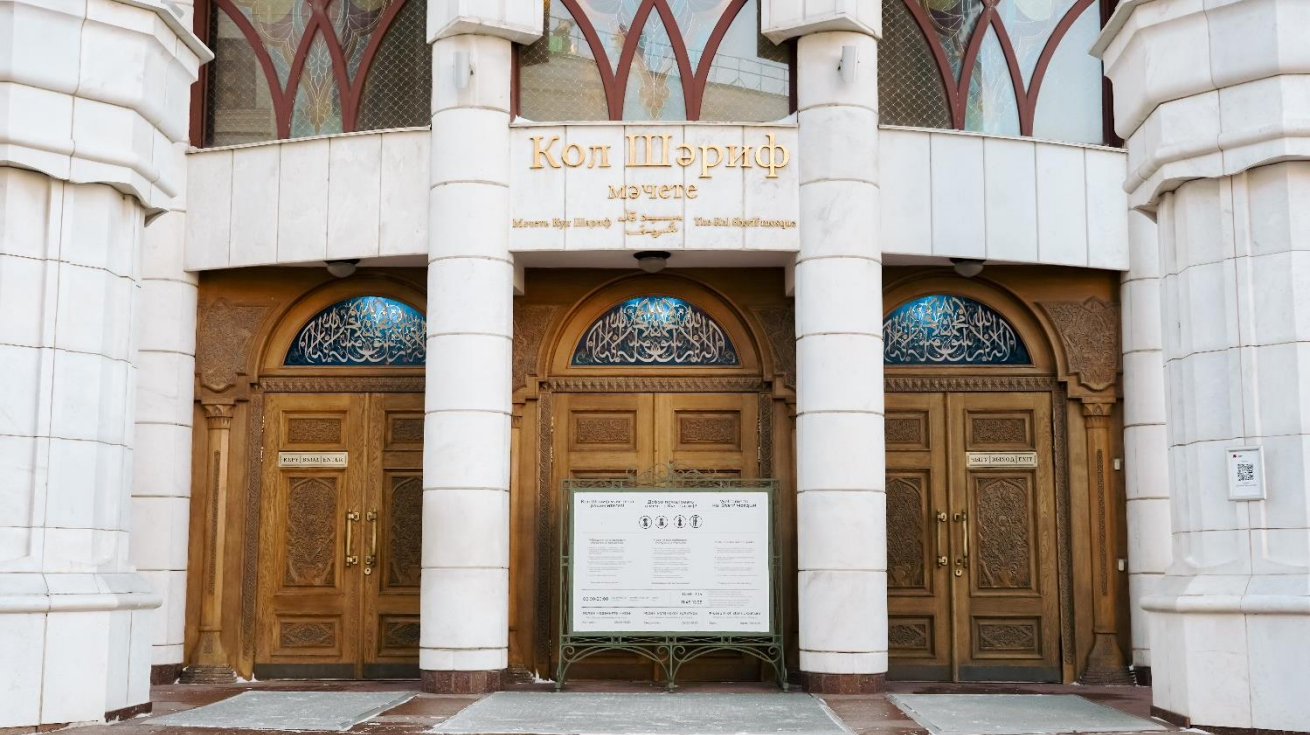
Вход в мечеть Кул Шариф выглядит так.