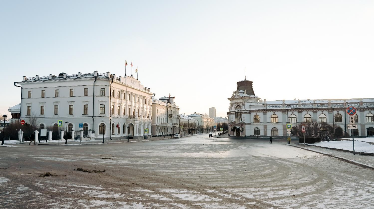
Это Площадь 1 мая. Здесь находится вход на территорию Казанского Кремля.